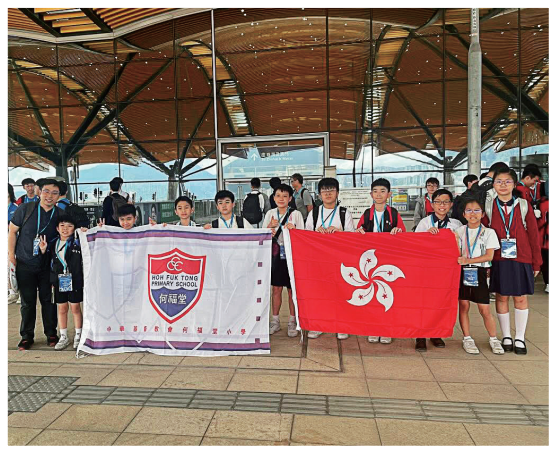
學生代表香港到珠海參加「粵港澳信息科技大賽」。

學校的創新教育成果屢獲嘉許，在大型比賽均獲佳績，充分彰顯學生在創意、科探及編程能力方面的卓越表現，並印證學校在推動創新教育上的成果。