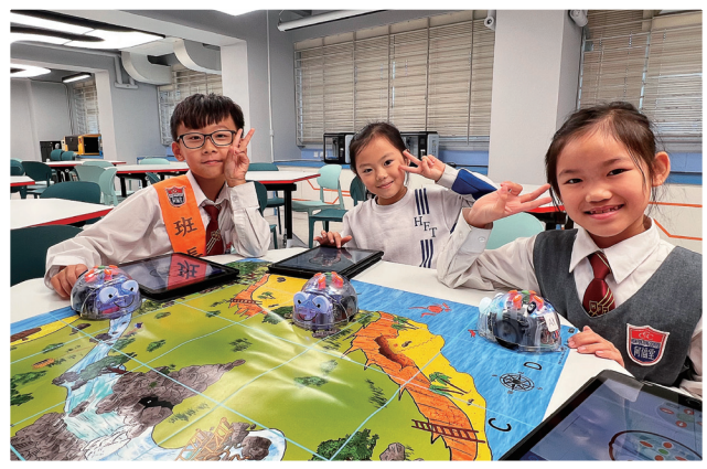
學生在編程創科培訓中心 (ITPC Room) 學習編程。

時至今日，教師團隊積極培養學生的學習態度與自信，讓孩子們在充滿關愛的校園裏享受學習生活。學校積極推動創新教育，並成功申請優質教育基金設立STEAM ROOM 與 ITPC ROOM (Innovation Technology Programming Center)。兩個學習空間分別透過科學探究、動手實作及編程教育，提升學生的創意、邏輯思維、科技能力及跨學科解難素養。