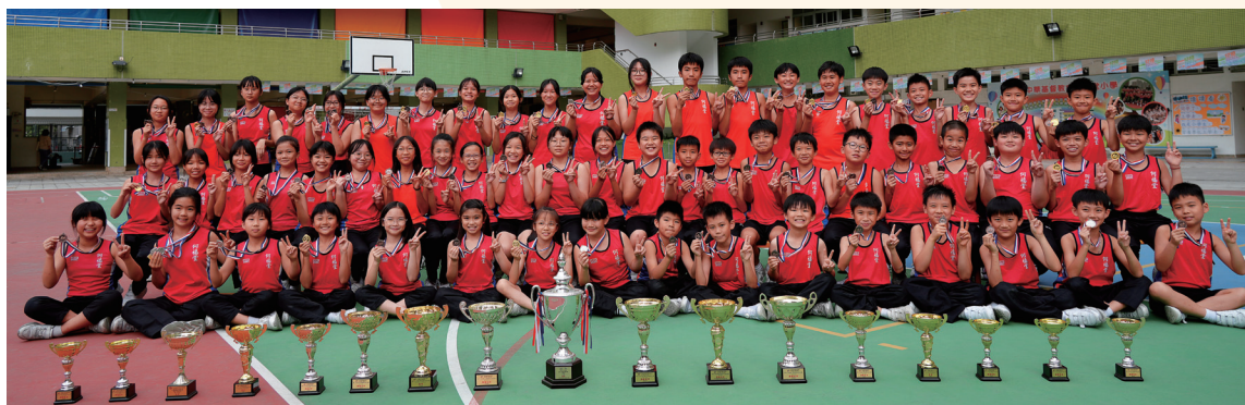
陣容鼎盛的田徑隊。

體育方面，近十年間，學校運動員於各項全港比賽中表現突出，成績斐然，不論個人項目或團體賽事，均展現出同學們的潛能與實力，締造了輝煌的體育成就。