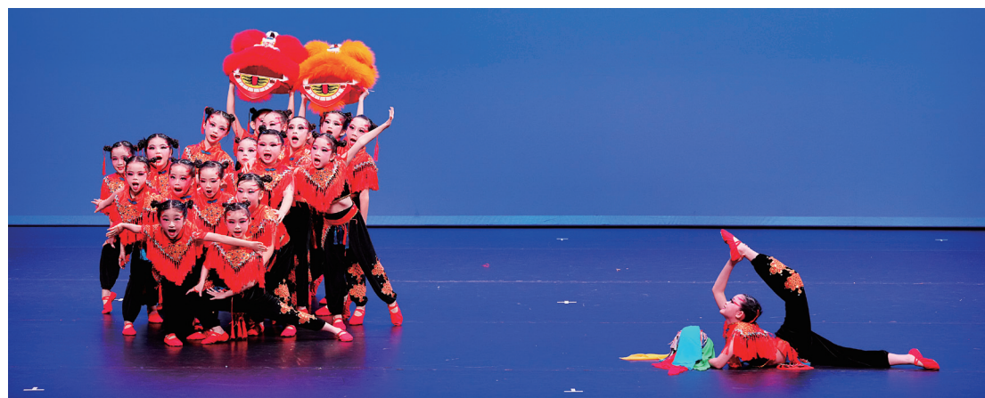
第六十二屆學校舞蹈節，初小中國舞《獅滾》獲優等獎。