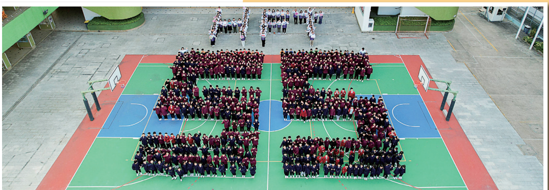
本校法團校董會及全體師生，祝學校55周年生日快樂！

展望未來，何福堂小學將持續向前邁步，為每位學生提供優質教育，見證學生在基督的愛滋養下成長與成就。我們與社區、校友、家長及教會攜手，培育心靈堅實、關懷社會、貢獻國家的新一代，讓每顆心都能發出屬於自己的光芒，創造非凡人生！