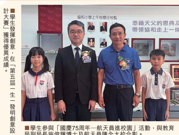
計大賽一獲優異成績，在「第五屆一一生一發明創設計大賽」獲優異成績。