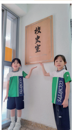
校史室以「十年樹木，百年樹人」為創建主題，感謝校友、家長及同學的無私奉獻，共同成就了今日的輝煌成果。

為傳承何小五十五載的故事，學校特別將三樓的多用途室裝修成校史室，以珍藏一代又一代人的足跡。今天是校史室開幕的日子，這地方將能讓學生學會感恩，明白何福堂小學今天的美好，是來自許多人一起孕育的成果。